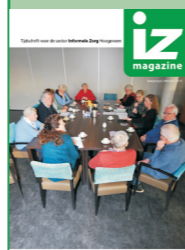
Impressie van een koffieochtend voor mantelzorgers in Hoogeveen.